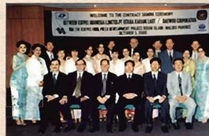
■ KUFPEC and DAEWOO group ■

KUFPEC does not only forecast success and increased production but also focuses on promoting Kuwaiti - Indonesian relationships on economic and social levels.