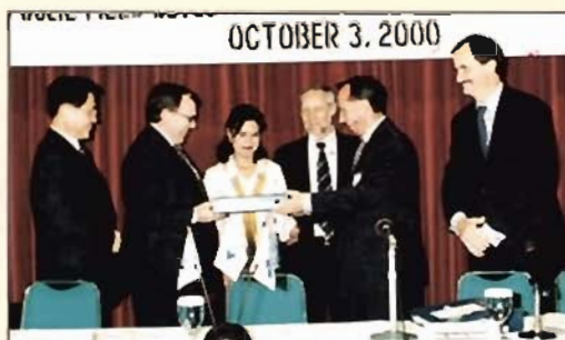
■ KUFPEC and DAEWOO Signing Ceremony ■

The Oseil oil concession development project in Seram Island, Indonesia is one of KUFPEC's leading investments. Oseil oil was first discovered in 1993 followed by two other wells, Oseil 2 and Oseil 4 in 1998. Estimated daily production of oil resulting from the Oseil concession is 15000 barrels / day with a reservoir of approximately 60 million barrels