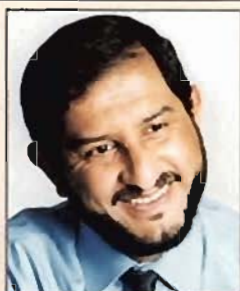
From The Editor -In- Chief

Shaban 1421 HJ - November 2000 - Issue 1