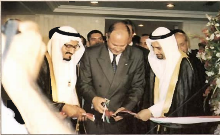
■ السيد / أحمد، السيد / منصف بن عبدالله والسفير الكويتي السيد / صلاح البييجان ■

شاركت كوفبك مؤخراً بمعرض الصناعات والاستثمارات الكويتية في تونس والذي استمر من ٩/١٨ لغاية ٩/٢٤/٢٠٠٠، وقد افتتح المعرض سعادة وزير الصناعة التونسية السيد / المنصف بن عبدالله تحت رعاية الوزير الأول التونسي السيد / محمد الغنوشي، كما حضر سفير دولة الكويت السيد / صلاح محمد البييجان افتتاح المعرض والذي ساهم فيه العديد من الشركات والمؤسسات الكويتية الحكومية والخاصة.