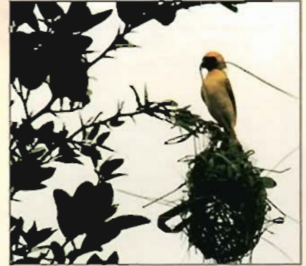
■ الصورة الحائزة على الجائزة ■