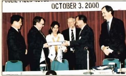
■ مراسم التوقيع بين كوفبك ودايوو ■

يعتبر مشروع تطوير حقل أوسيل للنفط الواقع في جزيرة سيرام شرق اندونيسيا من المشاريع الرائدة التي تقوم بها كوفبك في اندونيسيا، حيث تم اكتشاف حقل أوسيل في عام ١٩٩٢ وحفر فيه بئرين آخرين أوسيل ٢ وأوسيل ٤ وتم البدء في الانتاج عام ١٩٩٨ . يقدر الانتاج اليومي من النفط في حقول أوسيل ١٥ ألف برميل والتي تحتوي على مخزون نفطي يقارب الستين مليون برميل من النفط، واستمرار نجاح الانتاج شجع كوفبك - اندونيسيا على توقيع عقد مع مجموعة شركات تشمل استاناكارانغ لاولت IKL وشركة دايوو الكورية لتطوير هذا الحقل حيث سيتم حفر ٦ آبار اضافية، ومن المتوقع ان تنتهي المرحلة الاولى من اعمال التطوير خلال ١٨ شهرا ويتوقع البدء في انتاج الربع الاول من عام ٢٠٠٢ بطاقة انتاجية ما بين ١٢,٠٠٠ الى ١٨,٠٠٠ برميل في اليوم. وستتضمن اعمال التطوير انشاء وتوريد وتشغيل مركز تجميع وخزانات للنفط اضافة الى منشآت للتصدير، وبعد الانتهاء من اعمال الانشاء ستقوم المجموعة المنفذة بتشغيل وصيانة المشروع لمدة سنتين، وتبلغ قيمة العقد ٦١,٧ مليون دولار امريكي.