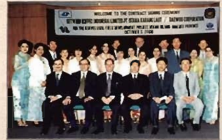
■ صورة جماعية لحفل التوقيع ■

وعلى الرغم من أن كوفبك تسعى دائما الى تحقيق النجاح وزيادة الارباح إلا أن لها دور هام ومساهمة ايجابية في تحسين العلاقات الكويتية الاندونيسية والعلاقات المتميزة التي تجمع بين الشركة والمناطق التي تعمل بها.